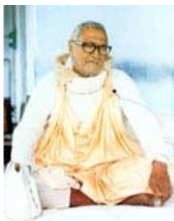
Его Божественная Милость Шрила Бхакти Ракшак Шридхар Дев-Госвами Махарадж